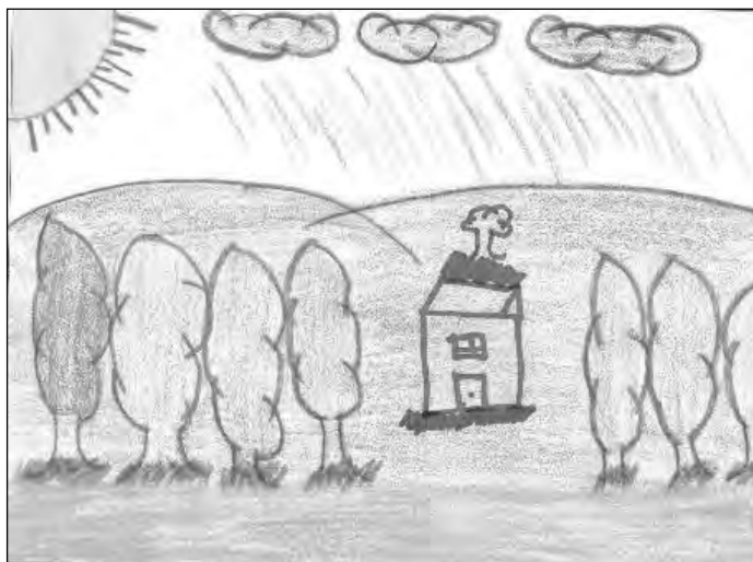
FIGURA n° 1. Dibujo de Ana Cristina Álvarez, 4°B

En los dos últimos grados de primaria se eligieron los cuentos de El llano en llamas . En quinto se leyó “La madrugada” y posteriormente se solicitó a los alumnos que realizaran una pequeña narración de su inspiración, de un párrafo o más, de San Gabriel, el escenario de la historia, pero durante la noche. Los resultados fueron exiguos, entre otras razones, por la falta del hábito de la escritura; la mayoría copió partes del cuento, y quienes no, escribieron poco y con faltas de ortografía (Figura 2). El cuento “Luvina” se utilizó para la estrategia de sexto grado que consistió, después de la lectura, en renombrar el lugar y realizar un dibujo según la descripción en el texto. En la mayoría de los casos, el nuevo título tuvo relación con el contenido; entre otros nombres escribieron: “El futuro mañana”, “La ciudad del infierno” y “Escalofrío”. De forma similar, en los dibujos se plasmó el ambiente que Rulfo describió para Luvina: un lugar sin vida, frío, con aire negro, sin vegetación, con tierra reseca y rajaduras (Figura 3).