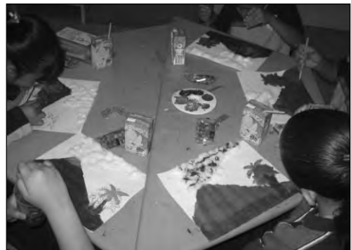
FIGURA nº 6. Alumnos del grupo 3ºB