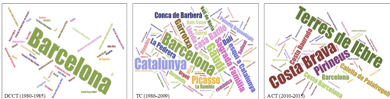
Figura 2. Nube de palabras del texto secundario

La principal diferencia con el periodo anterior consiste en un mayor uso de nombres de atractivos turísticos, como por ejemplo "Sagrada Família", "La Pedrera", "Casa Batlló", "Passeig Arqueològic" o "Vall de Núria", o nombres de artistas de renombre internacional como "Gaudí", "Picasso" o "Dalí". Mientras que en el periodo anterior se hacía especial referencia a localidades.