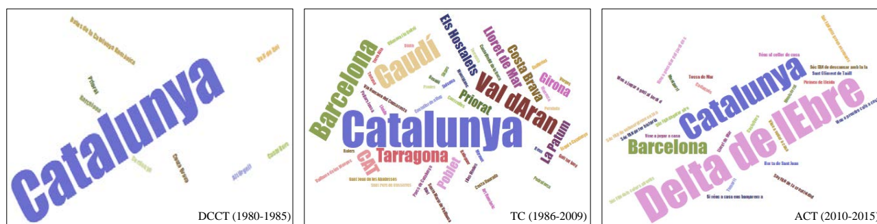
Figura 1. Nube de palabras del texto principal

Cabe destacar también que en algunos casos los carteles de este último periodo destacan como texto principal eslóganes utilizados en distintas campañas de comunicación y que pretenden invitar al individuo a visitar Cataluña, como por ejemplo Sóc FAN de fer història (Soy FAN de hacer historia) o Vine a sopar a casa (Ven a cenar en casa).