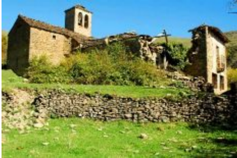
Ainielle, localidad situada en el Pirineo aragonés, es un símbolo de la despoblación.

Si alguno de los 18 habitantes del pequeño pueblo de Alentisque, en el sur de Soria, se pone enfermo, tiene dos opciones. La primera es esperar a que el médico pase por su pueblo, ya que al ser tan pequeño no tiene la opción de contar con un centro de salud propio. Si la emergencia es más grave, tendrá que desplazarse una media de 30 minutos a alguno de los centros comarcales, como pueden ser Almazán, Berlanga del Duero o Arcos de Jalón. Pero si la enfermedad requiere una consulta especializada, tendrá que desplazarse hasta Soria, capital de provincia.